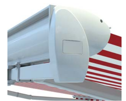
Typ s krycí stříškou a zadním krytem

Látka je při stažení chráněna z horní i zadní strany