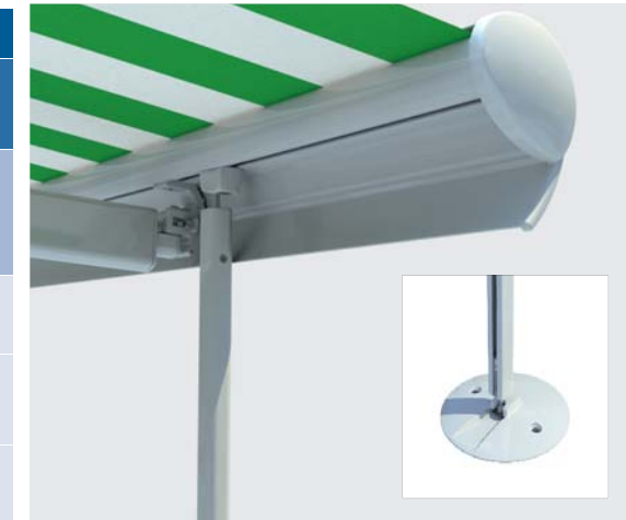
Obr. 5 Podpěrné nohy - volitelný prvek (příplatek) Zajišťují lepší stabilitu markýzy při nečekaných porывech větru, zvláště u markýzy s větší šířkou