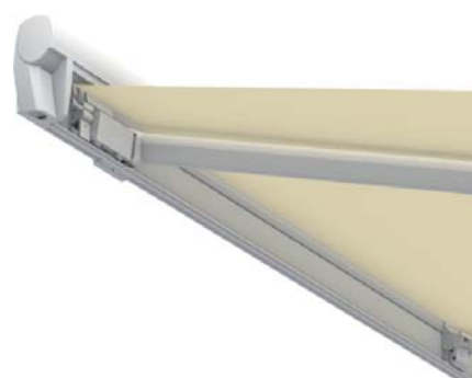
Obr. 3 - detail horního boxu