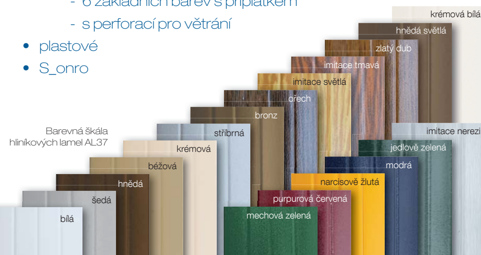
Barevná škála hliníkových lamel AL37