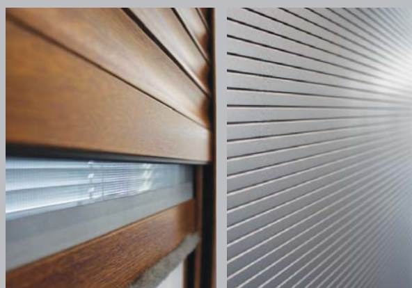
se sítí proti hmyzu